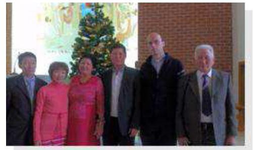
スロバキア出身、シベリアの宣教師 ヤン・ホヴァニャク司教